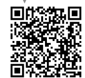
流山市公式アカウント