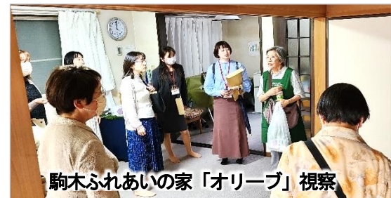
駒木ふれあいの家「オリーブ」視察