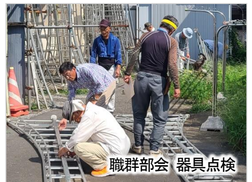
職群部会 器具点検