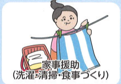
家事援助 (洗濯・清掃・食事づくり)