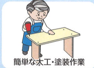
簡単な木工・塗装作業