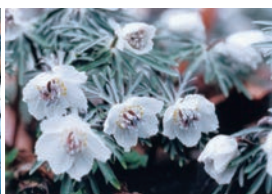
左：桜通り 中：沼と雪柳 右：セツブン草