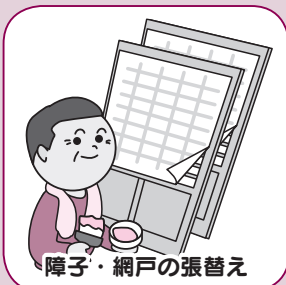
障子・網戸の張替え