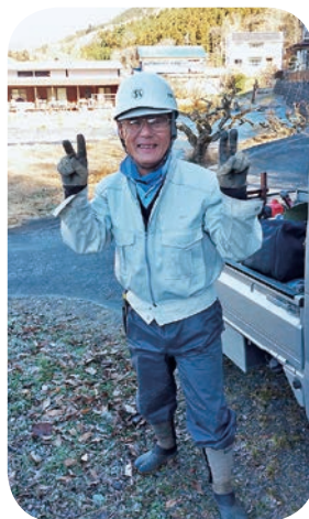
笑顔が素敵です (11月)