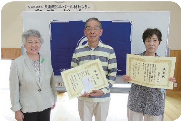
長年の活動に感謝 (6月)