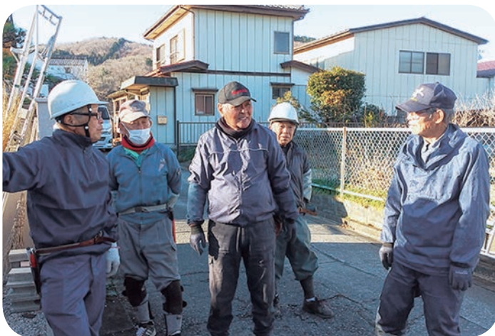
作業も無事終了 (11月)