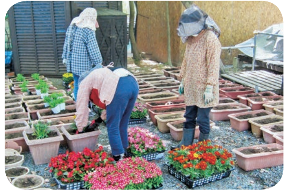
花いっぱいのもちづくり (4月)