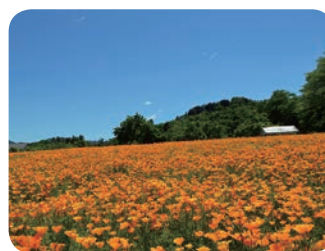
満開の花 (平成30年5月)