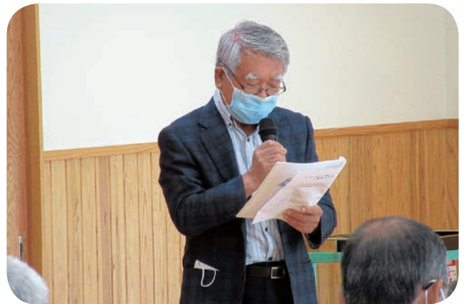
定時総会での監査報告 (6月)