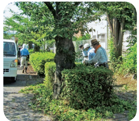
桜新道を綺麗に!! (6月)