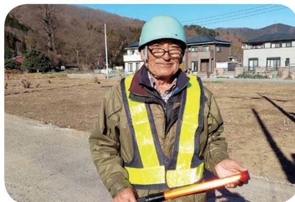
イケメンですね (12月)