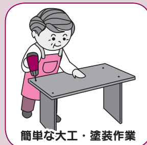
簡単な大工・塗装作業