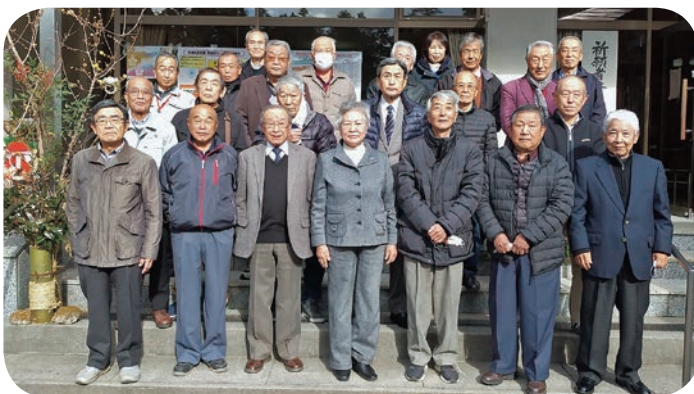
今年も安全・無事故を祈願 (1月)