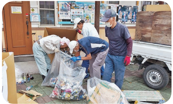
短時間でキレイになりました♪