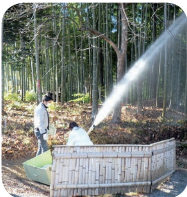
旧新井家住宅にて防火訓練を実施