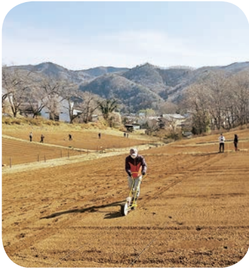
キレイに咲きますように🌻花の里 種まき・除草作業