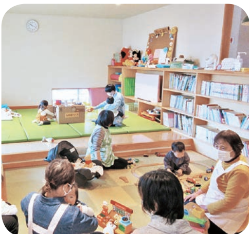
保育業務 ふれ愛ベース長瀬