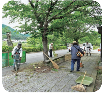
桜新道草刈り作業