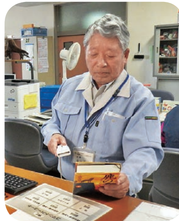
施設管理業務 中央公民館