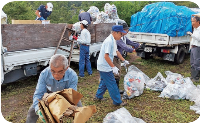
船玉まつり翌日ボランティア清掃