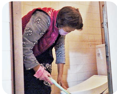
観光トイレ清掃 いつもピカピカです^^