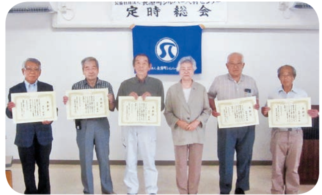
長年の活動に感謝