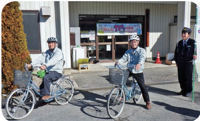
～カッチとプロジェクト～ 自転車に乗るときはヘルメットをかぶりましょう！