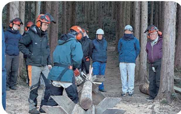
チェーンソー講習 安全な切り方を学んでいます。