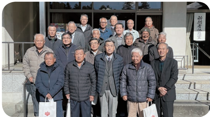
宝登山神社で恒例の安全祈願祭（1月）