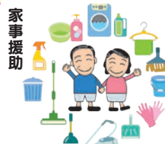
家事援助 (洗濯・清掃・食事づくり)