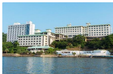
ホテル・食事イメージ