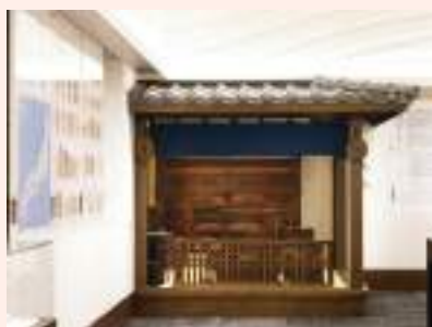
江戸時代の両替屋