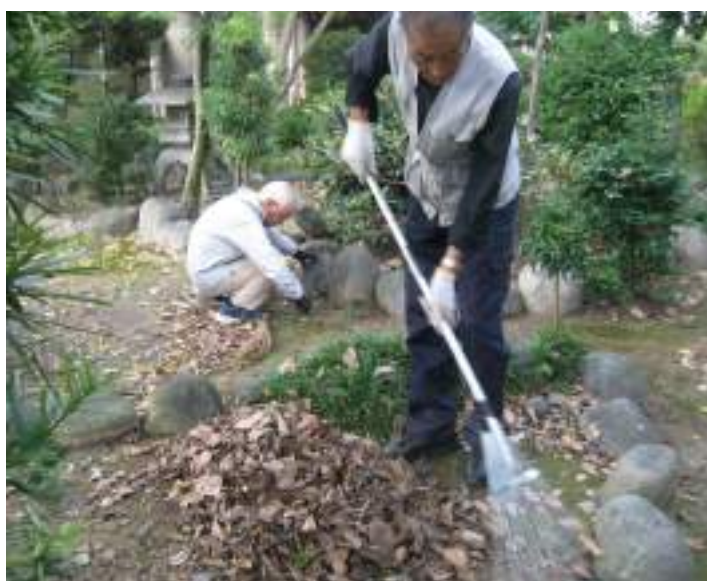
除草と石囲いの中の落葉集め