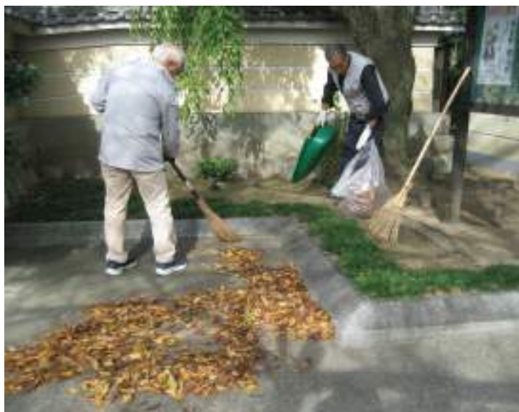
正門付近の落ち葉集め

庭の中は、木の根があつたり、石囲いの狭い所があつたりするので、道具も小さい専用の道具を追加するなど工夫しながら作業しています。除草については、腰や膝への負担が大きいです。それほど長く同じ姿勢をとるわけではないので、特に気になるようなことはありません。