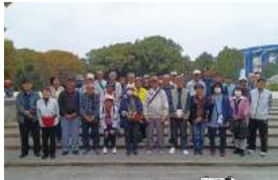
集合写真をパシャリ