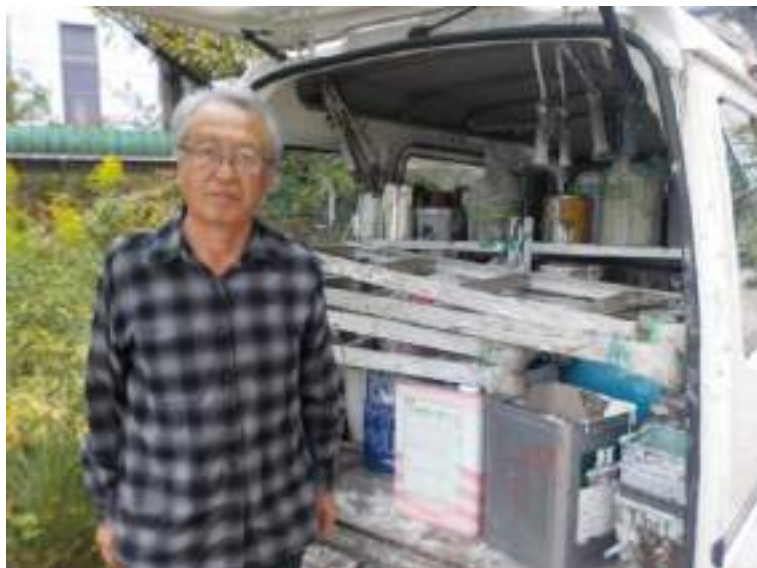
取材／片桐長良(機関誌編集委員)

仕事が終わって疲れのところ、快くインタビューに応じて頂きました。何十年も培った仕事の経験を活かし、この高齢化社会に貢献して頂ける事は誠にありがたいことです。皆様方の中にも、前職で取得された「資格」を基にシルバー人材センターで生かせる方が、多く選出されることを希望いたします。