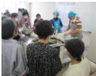
男シェフでつくろう簡単レシピの様子