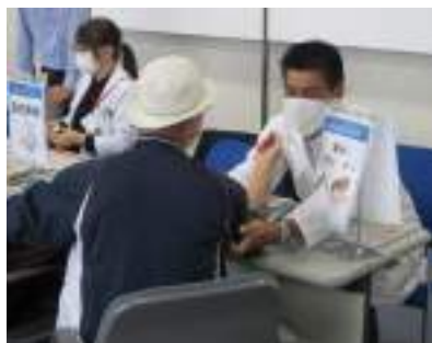
薬の相談コーナー・血圧測定の様子 (イオン薬局八事店)