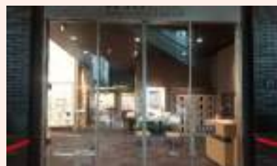
ミュージアムの入口

地下鉄栄駅と伏見駅の間に位置する三菱UFJ銀行名古屋ビル1階に貨幣・浮世絵ミュージアムがあります。貨幣展示室では、豊臣秀吉がつくらせた現存3枚の天正沢瀉(おもだか)大判など約4,000展が常設展示されています。浮世絵展示室には、歌川広重が描いた東海道を中心とした浮世絵版画の企画展が開催されています。便利な街中の落ち着いたミュージアムが無料で見学できます。