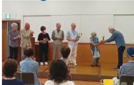
表彰式でトロフィー授与