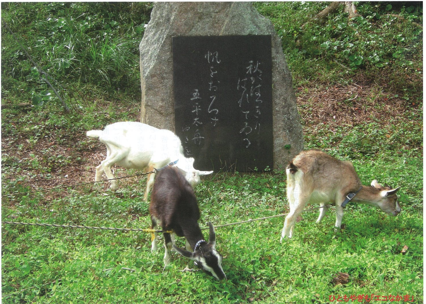
ひとみやぎも「エコながま」