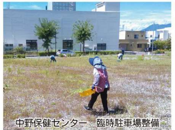
中野保健センター 臨時駐車場整備