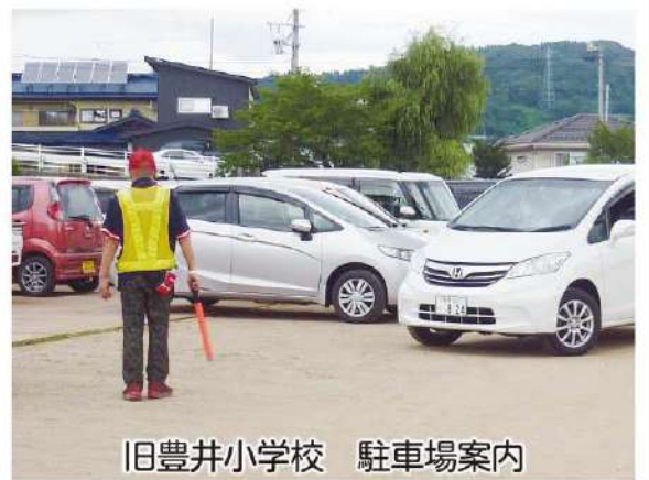
旧豊井小学校 駐車場案内