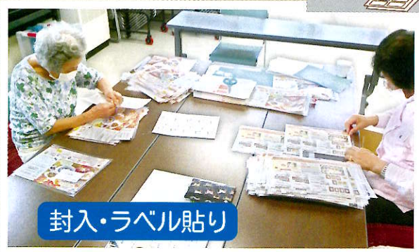
封入・ラベル貼り