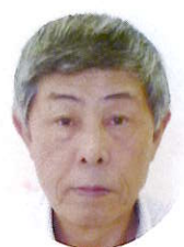
運転業務を 通して