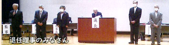
退任理事のみなさん