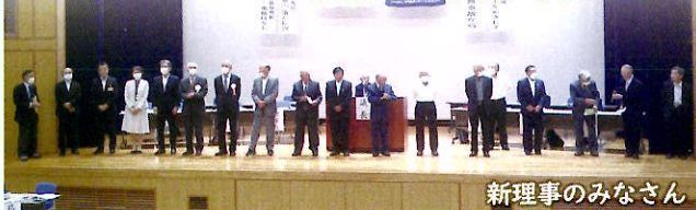
新理事のみなさん