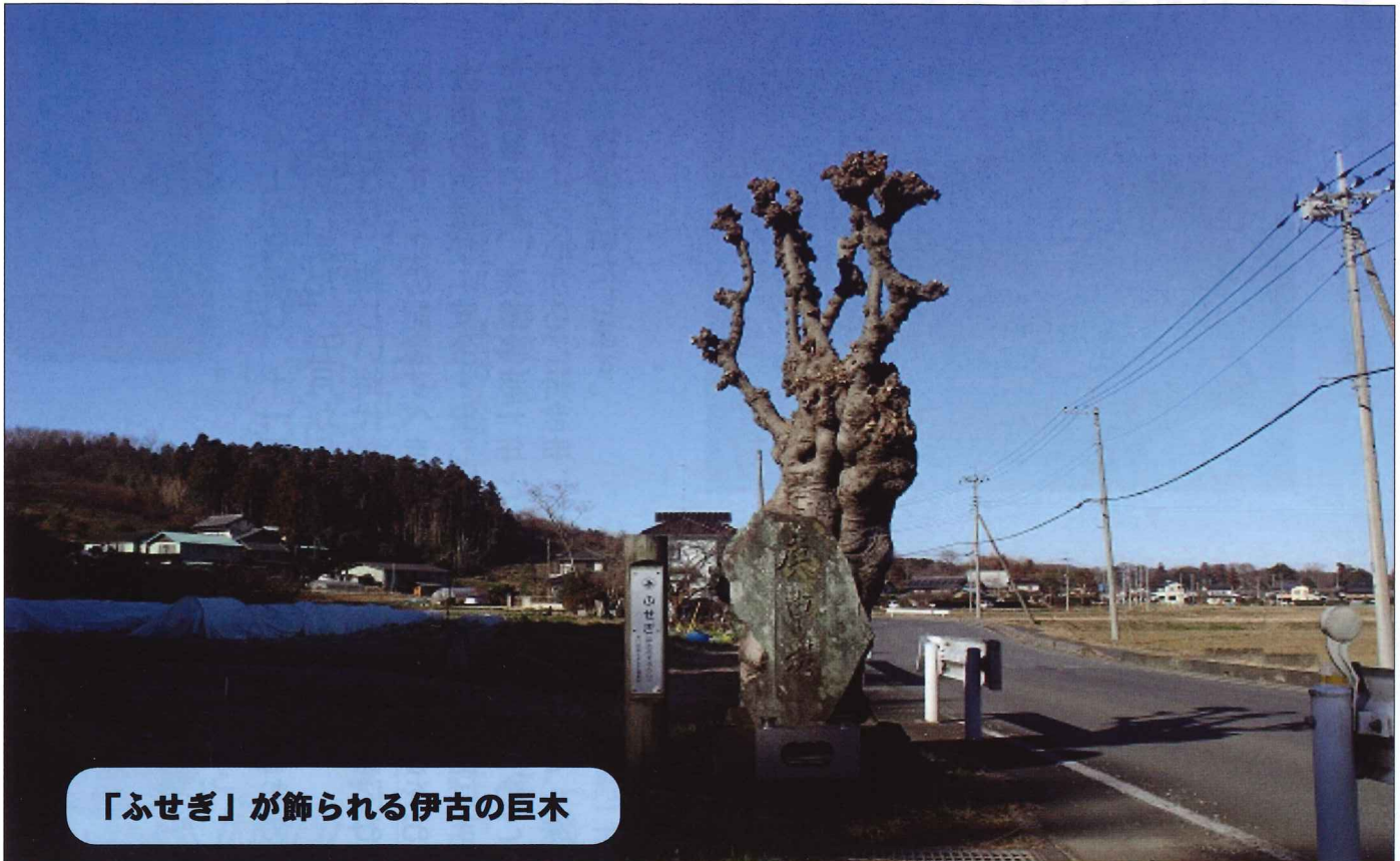
「ふせぎ」が飾られる伊古の巨木