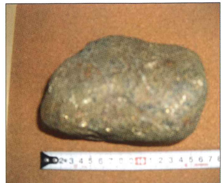
黄鉄鉱が含まれている石には、稀に金を含むことがあるそうだ