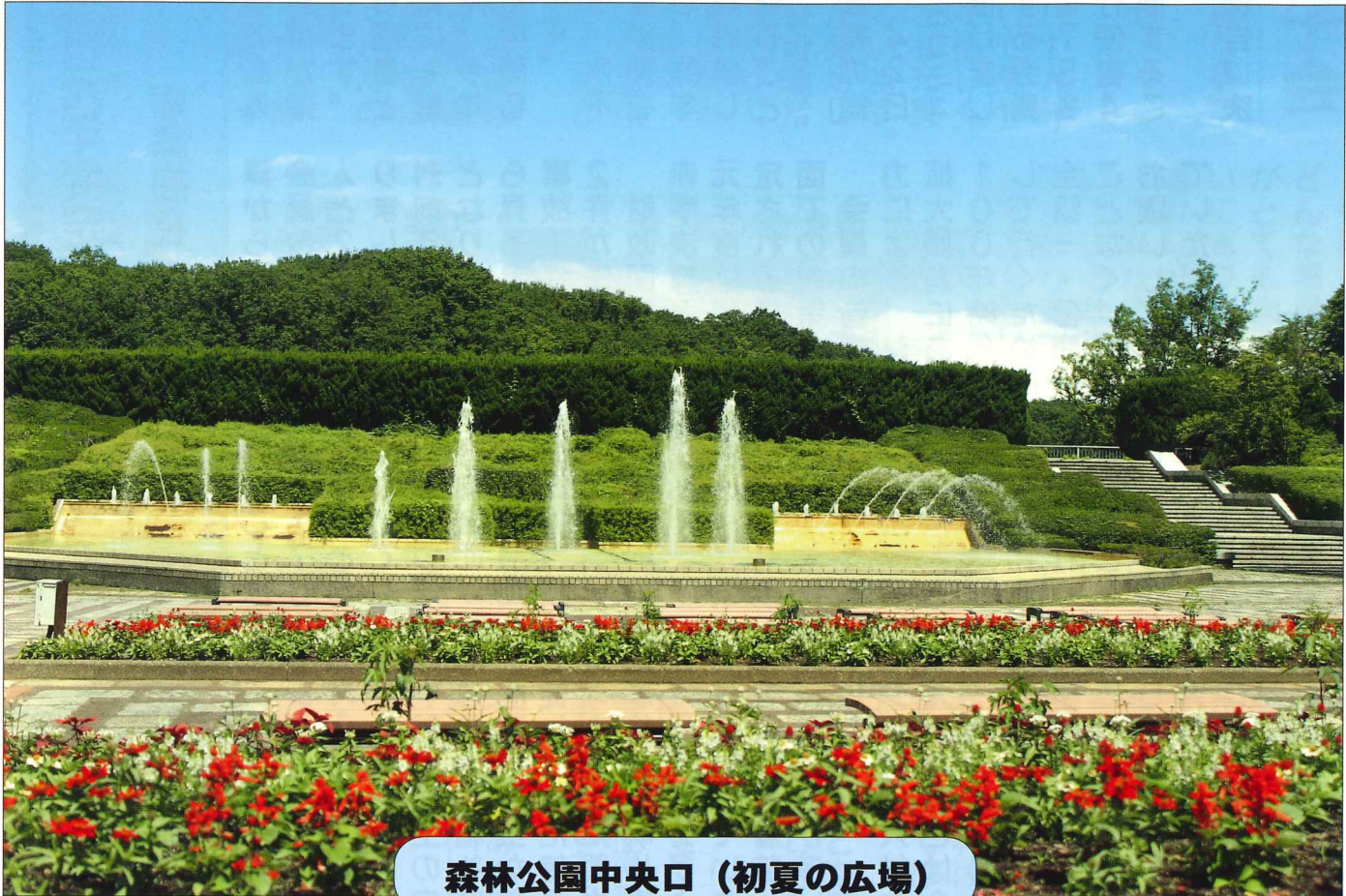
森林公園中央口（初夏の広場）