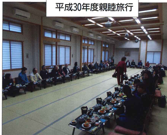
平成30年度親睦旅行

一 親睦旅行：十月十八日(金) 二 マレットゴルフ：十一月九日(土) 三 新年会：令和二年二月上旬 *日程は変わることもございます。