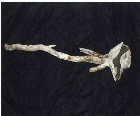
木の化石と思われる。先端部分に水をかけるとオパールのような色になる