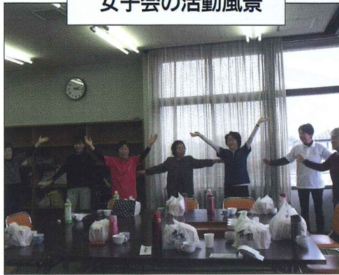
女子会の活動風景

やはり社会生活というものは、どんな場面に於いても人間関係がとても大事な事であり、お互いに気づかいを持って生きていきたいと思っております。これからも、女子会に限らずいろいろな行事・イベントに出来る限り参加協力していきたいと考えております。