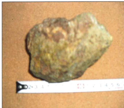
茶色い部分、釘を押し付けるとへこむ