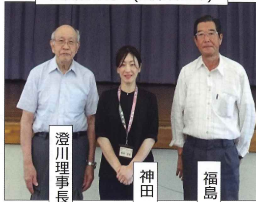
受賞者の方々(出席者のみ)