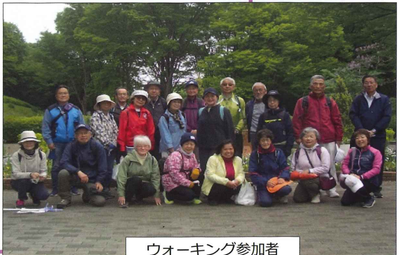
ウォーキング参加者