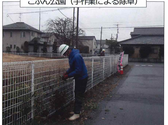
こぶん公園(手作業による除草)

作業員5名。2メートル程の 細かい低木で、脇枝がたくさん出 て、柔らかいため作業が難しくな るため、木の幹に紐で縛り固定し