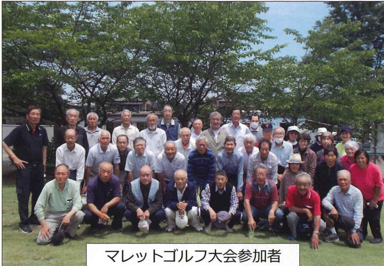
マレットゴルフ大会参加者