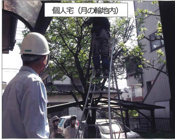
個人宅（月の輪地内）

作業者4名。庭が狭く植木は多い。庭木の剪定作業に1名は母の側で作業時間を隔る問題はない。松の作業が問題と思われ。