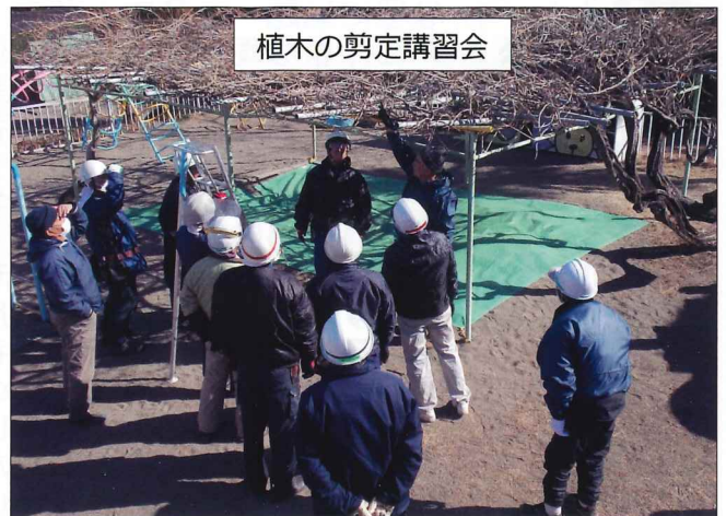
植木の剪定講習会

・宮前小学校 8月24日(土)7時〜 雨天中止(小雨決行) ・福田小学校 8月24日(土)7時〜 雨天順延(小雨決行) 予備日8月31日(土)