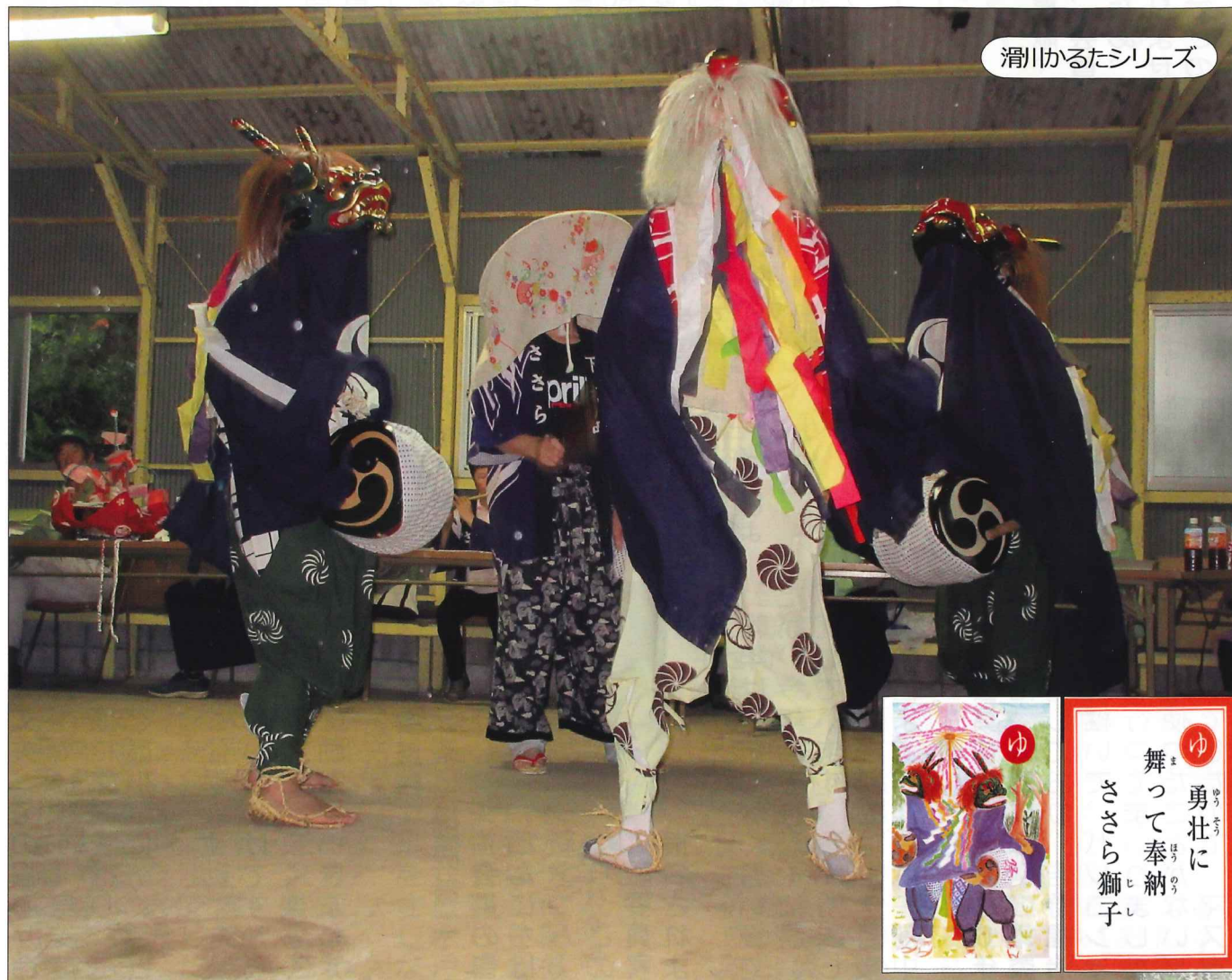
滑川かるたシリーズ