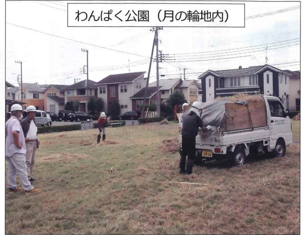
わんぱく公園（月の輪地内）

作業者4名。住宅街にある公園で、気温は39度。比較的暑い場所のため、作業は午前中に行い、水分補給や休憩をこまめに行う。また、安全対策として、ヘルメットや作業服を着用し、熱中症対策を講じた。