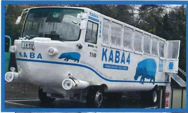
親睦旅行: 水陸両用KABAバス