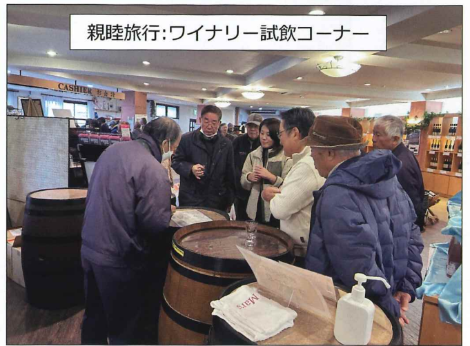
親睦旅行:ワイナリー試飲コーナー