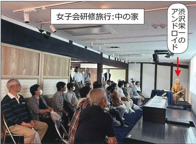
女子会研修旅行:中の家