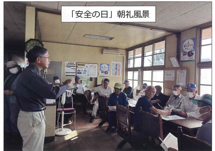
「安全の日」朝礼風景

車道と歩道の境の植栽剪定作業。ツツジの中に雑木などが混生しているため雑木を除去するの作業もあがり車両通行時が危険だが、のぼり旗を掲揚し周知で