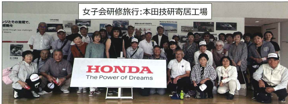
女子会研修旅行:本田技研寄居工場

本田技研工業の見学は好評で、モデルプラも作っているの車が上手に出来上がっている様子、学生時代に戻ったかのようなワクワク感をこの歳で味わえて良い経験ができました。