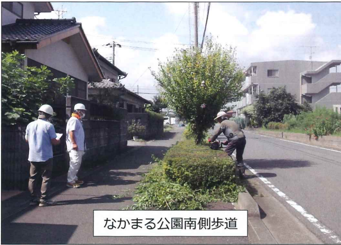
なかまる公園南側歩道

中央の丘はハンマーナイフモアを使用し作業する。傾斜地のため滑りや転倒のリスクがあるが、