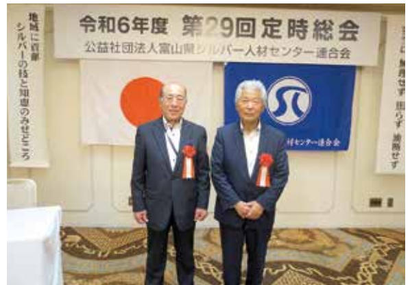
写真は神田会員(左)