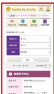
Smile To smile による提示

フリーランス新法が施行されると、センターは下記の内容を会員の皆様にお伝えすることが義務付けられます。(発注者が個人家庭の場合はフリーランス法の適用外)