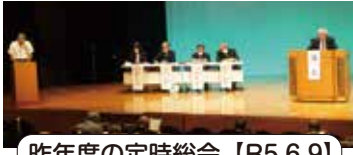
昨年度の定時総会【R5.6.9】

「自立して生き生きと 日常を送りたい!!」 「くすりの疑問、 なんじゃ かんじゃ?」