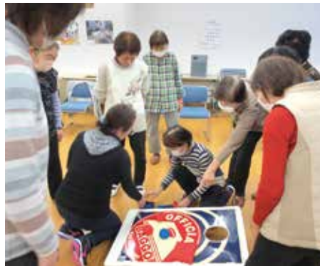
2/27 女性部の集い スポーツレクリエーション