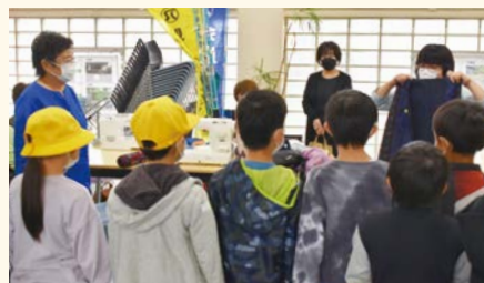
町たんけんを訪れた小学生

は、シルバー会員の就業以外の活動を知ってもらおう絶好の機会となりました。実際に見学した子どもたちは、製作中の作品やこれまでに製作したものを目の前にし、うなずいたり歓声を上げたりしながら会員の説明に熱心に耳を傾けていました。 小学生たちの突然の見学などもあり、いつもと違う雰囲気でのミシンカフェとなりましたが、今回初めて参加した会員からは、「趣味を通していろいろな仲間と知り合うことで、就業以外の新たなシルバーの一面を知ることができました」との感想も寄せられました。これからも会員同士のふれあいが深まるような催しを企画し、女性会員の活性化に繋げていく予定です。