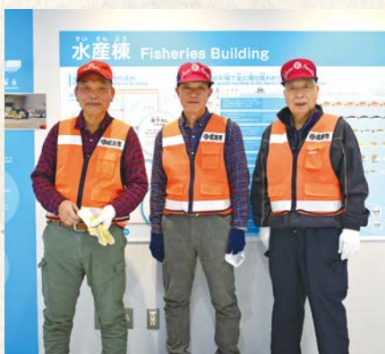
左から諏訪会員、山倉会員、森池会員

が主な仕事で、会員の平均年齢は75歳。多いときは1万5千歩くらい歩くので、体力が必要とのことでした。お互いに協力することによって、個々の体力面などを補いつつ作業し、事故防止などを図っているそうです。会員同士の連携やコミュニケーションの重要性を再認識できました。