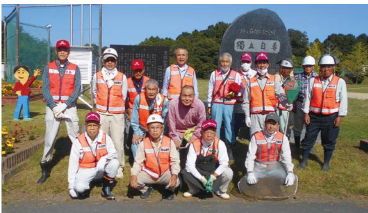
除草作業に参加した会員(豊住小学校で)

シルバー人材センターは、地域における高齢者の就業の場として見られていますが、本来の姿は、会員同士が助け合い、仲良く働きながら交流を深めたり生きがいを見つけたりし、かつ地域社会にも貢献していくという目的をもった組織です。