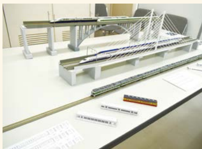
精巧に作られた鉄道模型

わたしの趣味は鉄道模型作りです。30歳から始めましたが、小さい頃から鉄道が好きで絵を描くといったら電車ばかりでした。車両が好きで集め始め、今では100編成程になりました。たくさん集めると実際に走らせてみたくなり、それが鉄道模型作成への道となりました。鉄道雑誌に掲載されている写真から作ってみたいと思う鉄橋を選び、その設計図をウェブサイト