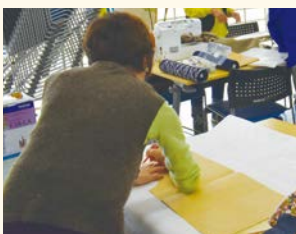
慎重に生地を裁断

また、この日は久住小学校2年生の児童16名が、授業の一貫で町への親しみと愛着を深める目的で行われている「町たんけん」として、当