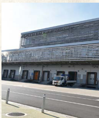
高機能物流棟の外観

が主な仕事で、会員の平均年齢は75歳。多いときは1万5千歩くらい歩くので、体力が必要とのことでした。お互いに協力することによって、個々の体力面などを補いつつ作業し、事故防止などを図っているそうです。会員同士の連携やコミュニケーションの重要性を再認識できました。