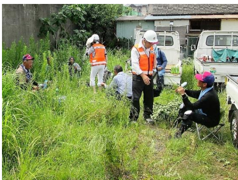
○場所① 並木町(内野市宮住宅) ○内容 除草作業