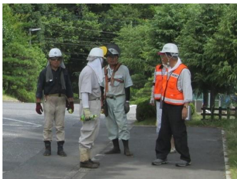
○場所② 加良部(新山小学校) ○内容 除草作業