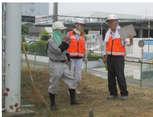
○場所③ 新泉(米屋第2工場) ○内容 除草作業