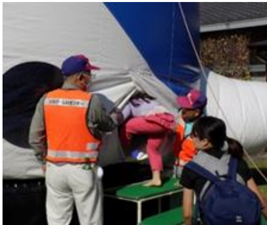
ふわふわドームでの会員の様子

【B班】 ・10月20日、21日の両日、健康・福祉まつりのボランティアに延19名が参加しました。天気にも恵まれ多くの来場者がありました。来場者カウント、ロードトレイン受付、風船配布時の整理、ふわふわドームの受付を行いました。