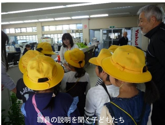
職員の説明を聞く子どもたち