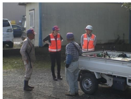
○場所 南三里塚(バス回転場) ○内容 除草作業