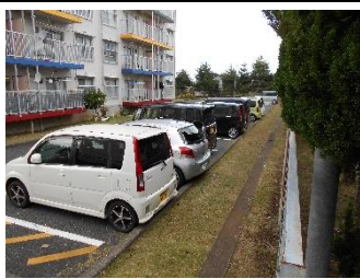
除草作業事故現場

●事故 ガラス破損 ●就業内容 除草作業 ●事故内容 防護ネットを使用せずに刈払機で除草作業を行い、飛び石で駐車していた車の後部ガラスを破損した。