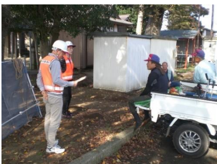
○場所 三里塚(駐輪場) ○内容 除草作業