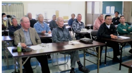
熱心に話を聞く会員