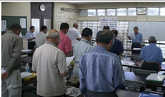
会議の前にスローガンを唱和する会員

集まり、来シーズンに備えた暑さ対策について協議しました。現在は、会員個々で工夫していますが、「暑いから」という理由で休憩を長く取り、就業を早めに取り上げることに