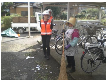
○場所 滑川駅(駐輪場) ○内容 除草作業