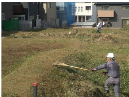
○場所 久住中央(空地) ○内容 除草作業