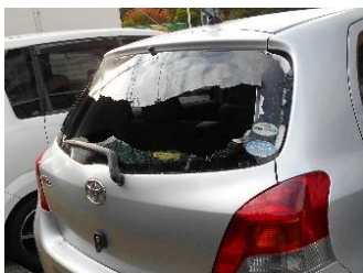
飛び石により破損した車両