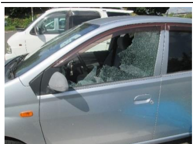
飛び石により助手席のガラスを破損させてしまった車両(玉造第4県営住宅で)

9月24日に急遽、臨時安全・適正就業委員会を開催し、飛び石によって自動車の窓ガラスを割ってしまった事故に対する調査と原因究明をするため会員へのヒアリングを行いました。その結果、誤った防護ネットの使用による事故と判明しました。ネットを直接車両に被せていたため石等が飛散した際に効力