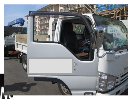
通パト車両に接触によりできた傷(中台 松の下公園で)

10月7日、臨時安全・適正就業委員会において2件の事故の審議・判定が行われました。1件は前回の臨時安全委員会から程なく飛び石による事故が発生しましたが、ネットの使用を徹底していたにもかかわらず、未使用により発生したものでした。今回の飛び石事故は駐車中の車で、幸い人は乗っていませんでしたが、乗っていた場合は傷害事故になり得るため、委員会でも厳しい処分が下されました。(写真上) 2件目は、通学路防犯広報啓発活動中の事故で、通パト車を後退させる際に後方にあつた台風で倒壊した屋根に接触してしまつたものです。周囲の確認、後退時の運転に対する過信により発生もので、前方に転回すれば避けられた事故です。(写真下)