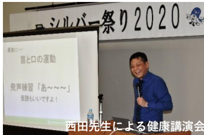
西田先生による健康講演会