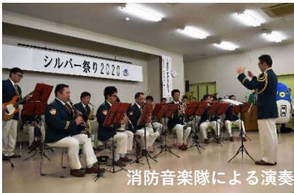
消防音楽隊による演奏

ラリンピックホストタウン事業紹介展示、パラリンピック種目「ポッチャ」競技体験、血管年齢・脳年齢測定ができる健康コーナーもあり盛況のうちに「シルバー祭り2020」は幕を閉じました。