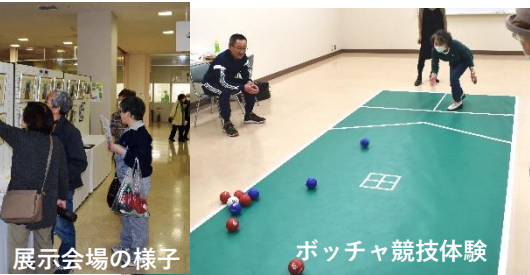
ポッチャ競技体験

※予定していたパークゴルフ・ボウリングの大会は、新型コロナウイルス感染症の影響により中止となりました。