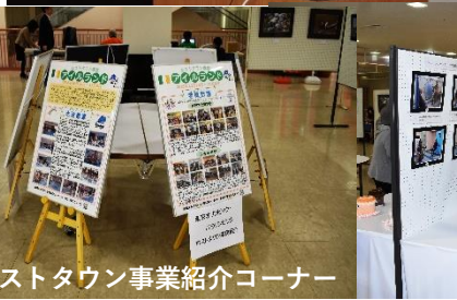
ホストタウン事業紹介コーナー