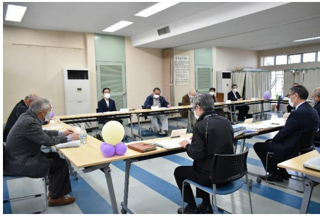
3蜜を考慮して開催