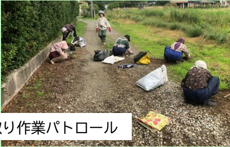
草取り作業パトロール

7月から10月にかけて、毎月第3水曜日に安全パトロールを実施する予定です。7月は特定の曜日にこだわらず、委員（事務局）が各現場を巡回し安全確認を行いました。パトロールでは、作業環境の点検や、安全装備の適切な使用状況の確認等をチェックしています。これにより、事故の未然防止を図り、全ての会員が安全に作業できる環境づくりを推進しています。