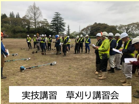
実技講習 草刈り講習会

令和6年4月、那須町の伊王野山村広場において、草刈り作業に関する安全講習会を実施しました。那須町森林組合より講師をお招きし、安全の心得、実技指導、そして点検方法について学びました。この講習会は、毎年5月から6月にかけて草刈り中の事故が発生する率が高いことを受け、草刈りシーズンに入る前に行われるものです。参加者は、草刈り作業に必要な基本的な安全知識を再確認し、安全な作業手順について実際に体験することで、事故防止への意識を高めました。