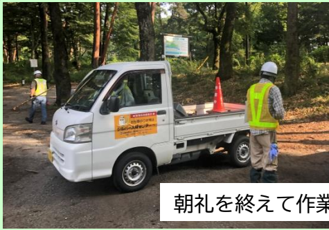
朝礼を終えて作業開始

安全適正就業委員会では会員の皆様が安全に作業できるように下記の活動をおこないました。