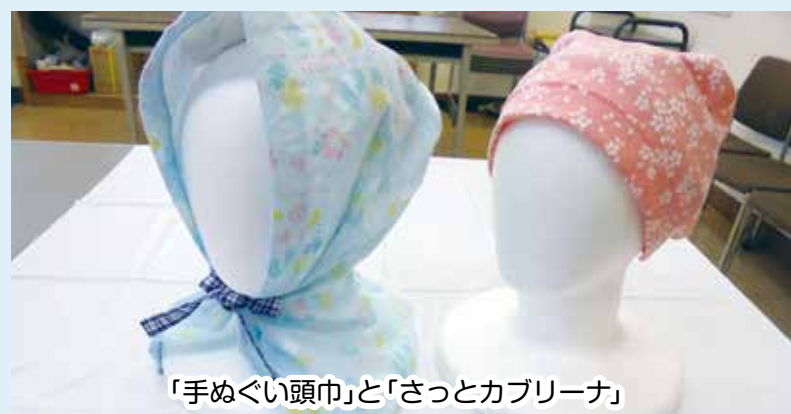
「手ぬぐい頭巾」と「さっとカブリーナ」