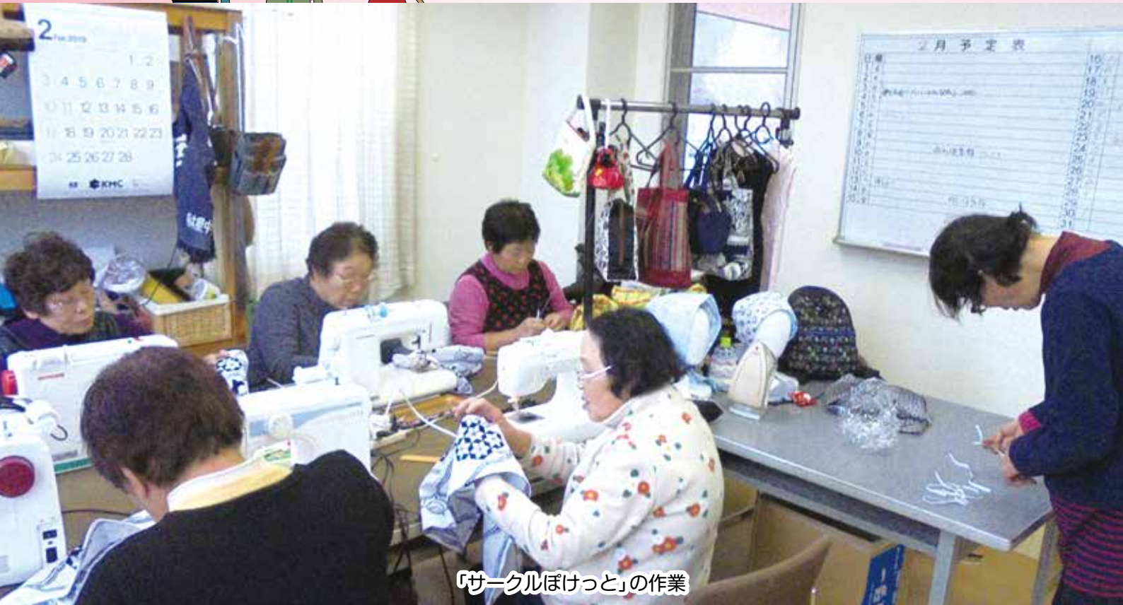
「サークルほけっと」の作業