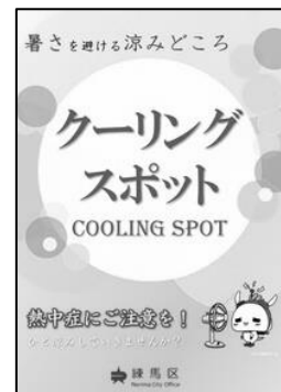
クーリングスポット目印

また、外出時に暑さを感じた際に冷房の効いた室内で一時的に休憩できるよう、一部の区立施設および薬局を「クーリングスポット(涼みどころ)」として開放しています。