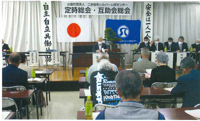
↑令和4年度 定時総会の様子 コロナ対策の為、マスクを着けての開催

公益社団法人二本松市シルバー人材センター令和四年度定時総会を、去る六月十日(金)午後一時三十分から、二本松福祉センターで開催しました。過去二年間新型コロナウイルスの影響で書面決議による開催としてきましたが、今年度は、書面決議・委任状による参加も含めて三三一名の参加となり、会員総数四四九名の過半数を超え総会は有効に成立しました。