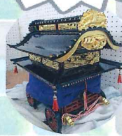
会員作成のミニ太鼓台