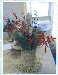
門松作り体験で作成した門松