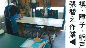
襖・障子・網戸 張替え作業◀