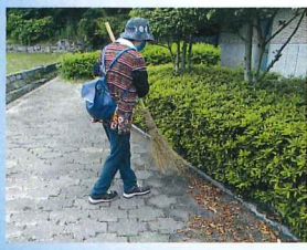
屋内施設 清掃作業▶