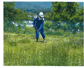
▲機械刈除草作業:慣れた自分自身の機械で作業する事ができます。