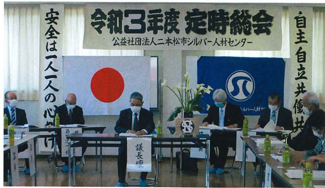
▲令和3年度 定時総会の様子 コロナ対策の為、マスクを着けての開催

公益社団法人二本松市シルバー人材センター令和3年度定時総会を、去る6月10日(木)午後1時30分から、二本松市シニア生活館で開催しました。 今年度についても昨年に続き、新型コロナウイルス対策のため、会員には出席を求めず議決権行使としてお願いし、総会には、議決権行使書により出席扱いとなる341名を含め、357名の出席がありました。