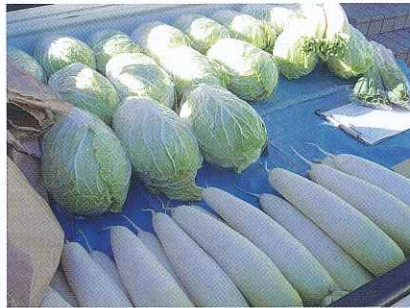
販売される白菜・大根