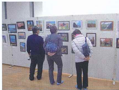
掲示物の写真に見入る