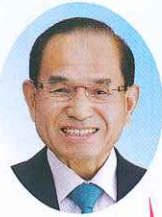
二本松市長 三保 恵一

新年明けましておめでとうございます。 ご希望に満ち輝かしい新春を穏やかに迎えたいと心より喜び申し上げます。