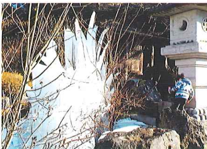
撮影場所：高林寺（太田）