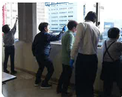
おそうじマイスターのお掃除講習