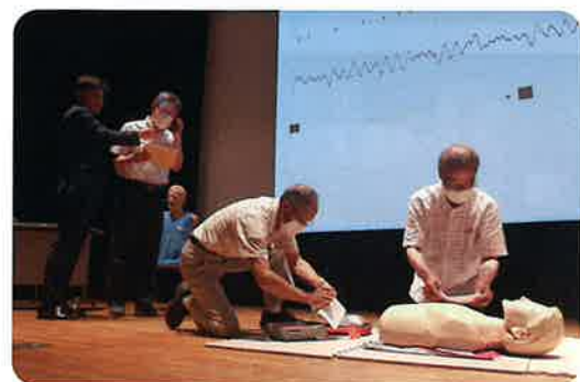
デモンストレーション