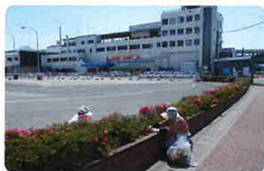
●両津港周辺歩道花壇整備