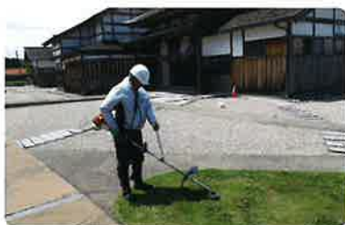
●佐渡奉行所跡管理業務