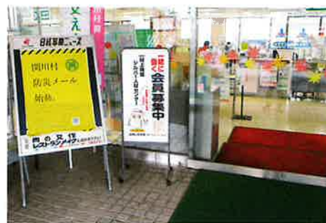
会員募集看板（関川村役場）

新型コロナウイルスの影響で減少した会員数を増やすため、会員募集看板を製作し、村上市役所、関川村役場など6か所に設置しました。また、会員募集チラシの全戸配布を1回、新聞への折り込みを2回実施し、入会の呼び掛けを行いました。