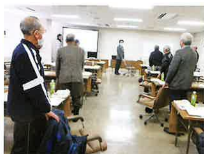
感染症対策と屋内でできる軽めの体操

〒958-0837 村上市三之町1番6号 村上市勤労者総合福祉センター内 TEL 0254-53-6486