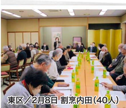
東区/2月8日 割烹内田(40人)