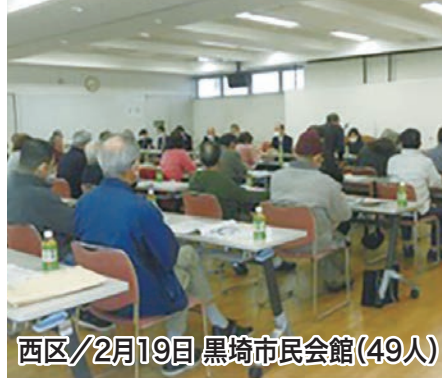
西区/2月19日 黒崎市民会館(49人)