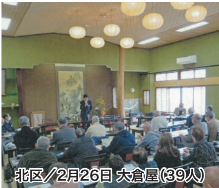
北区/2月26日 大倉屋(39人)