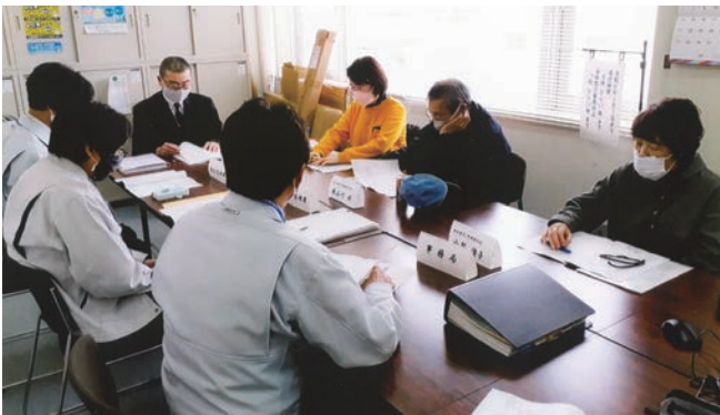
運転業務に関わる派遣会員の教育訓練受講状況について

取材を通して、会員の皆さんの安全就業を確保するためにも、事故例を元にした再発防止策、ヒヤリ・ハットの分析を発信すべく重要な責務を担っている姿を垣間見ました。(青木)