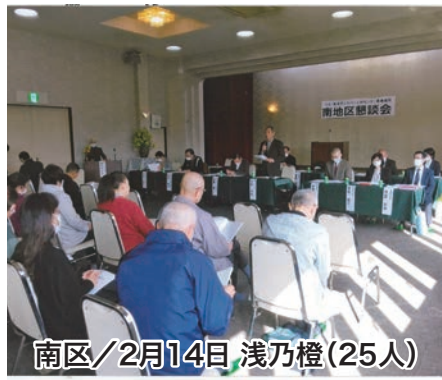
南区/2月14日 浅乃橙(25人)