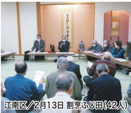
江南区/2月13日 割烹ふじ田(42人)