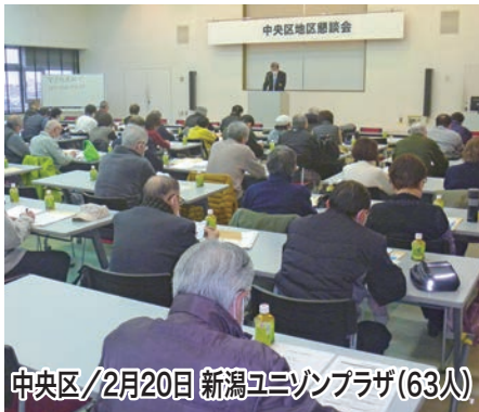
中央区/2月20日 新潟ユニソンプラザ(63人)