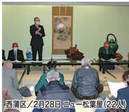
西蒲区/2月28日 ニュー松葉屋(22人)