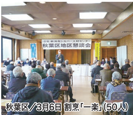
秋葉区/3月6日 割烹「一楽」(50人)