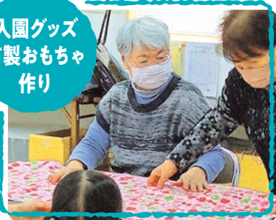
入園グッズ 布製おもちゃ 作り