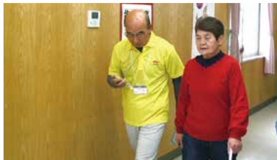
真剣な面持ちで「歩行速度」の測定

張りどき、のなかで自分はこのレベルに位置するのか、真剣にグラフと照らし合わせていました。嬉しそ