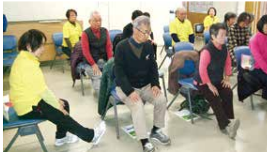
まずは準備運動で体をウォームアップ

ランス等の体力テストをサポーターと測定員で実施しました。測定後、各自に配布された測定用紙に測定員が計測数値を記入して返却、各自壁に貼られた性別、年齢別のグラフと照合します。