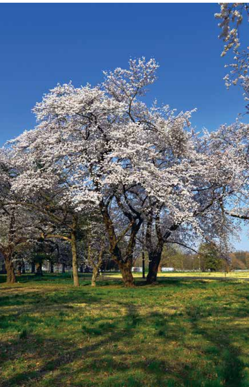
西堀3 通信所のサクラ