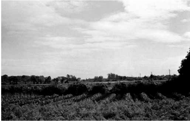
昭和35年当時の野火止

私が新座に移住したのは平成15年3月。4市合併の住民投票でざわついていました。当時から周辺の写真を撮り続けましたが、変化の激しさに驚きます。 「あれ！この場所は何処？」と思う事が時々あります。ほんの2、3年前なのに、そこに何があったか判らないことがあります。