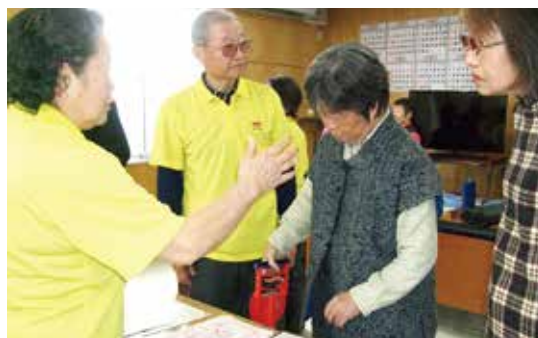
測定器による「握力テスト」

最初の第1回と最後の10回に体力測定を行い、教室で実践した結果、身体がどのように変化したのかを数値などで評価が確認できます。プログラムの一例を上記に掲げておきますので参照下さい。(中村和明)