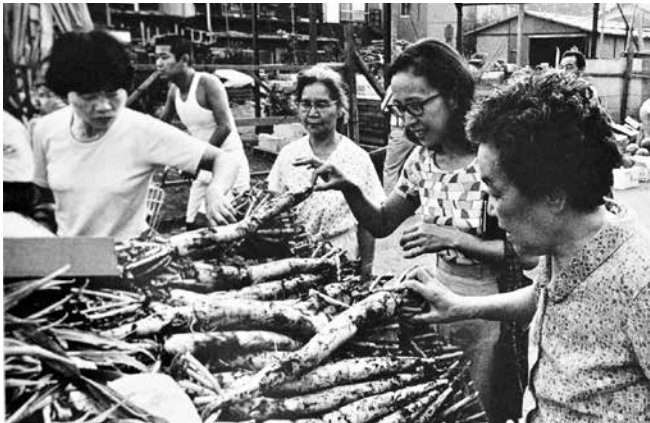
昭和60年代石神の朝市 (新座写真連盟写真集より)

まれ「新座の古写真」ありませんか？と本誌100号で呼びかけました。早速反応があり、昭和63年