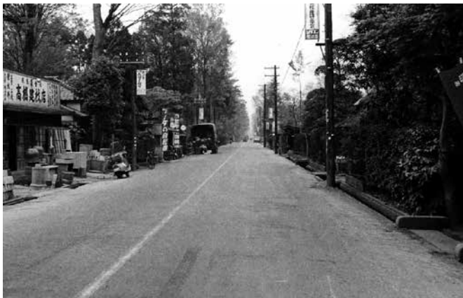
左端が目印になった「高橋建材店」で昭和38年創業

志木では志木駅周辺など色々な写真が出てきますが、新座は平林寺周辺のものが手に入る程度です。東京通勤圏としての利便さで、「埼玉都民」が増えるに従って、徐々に写真資料が増えてきます。