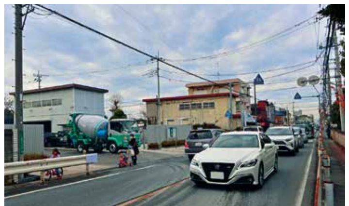
令和2年2月旧川越街道の同じ場所、道幅は同じ筈ですが

3段目の写真は市役所の資料写真で昭和40年頃の旧川越街道の風景です。写真に写る「高橋建材店」から現在に繋がりました。