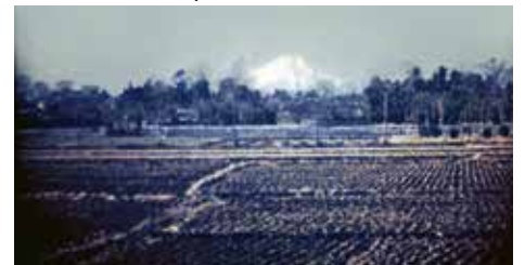
野火止辺りから望む富士山

看板の「魚久」は営業場所を移転済みです。現交差点角の建物にかかる緑の暖簾が、何気に歴史を伝えてくれています。隣に見える茅葺の家は、