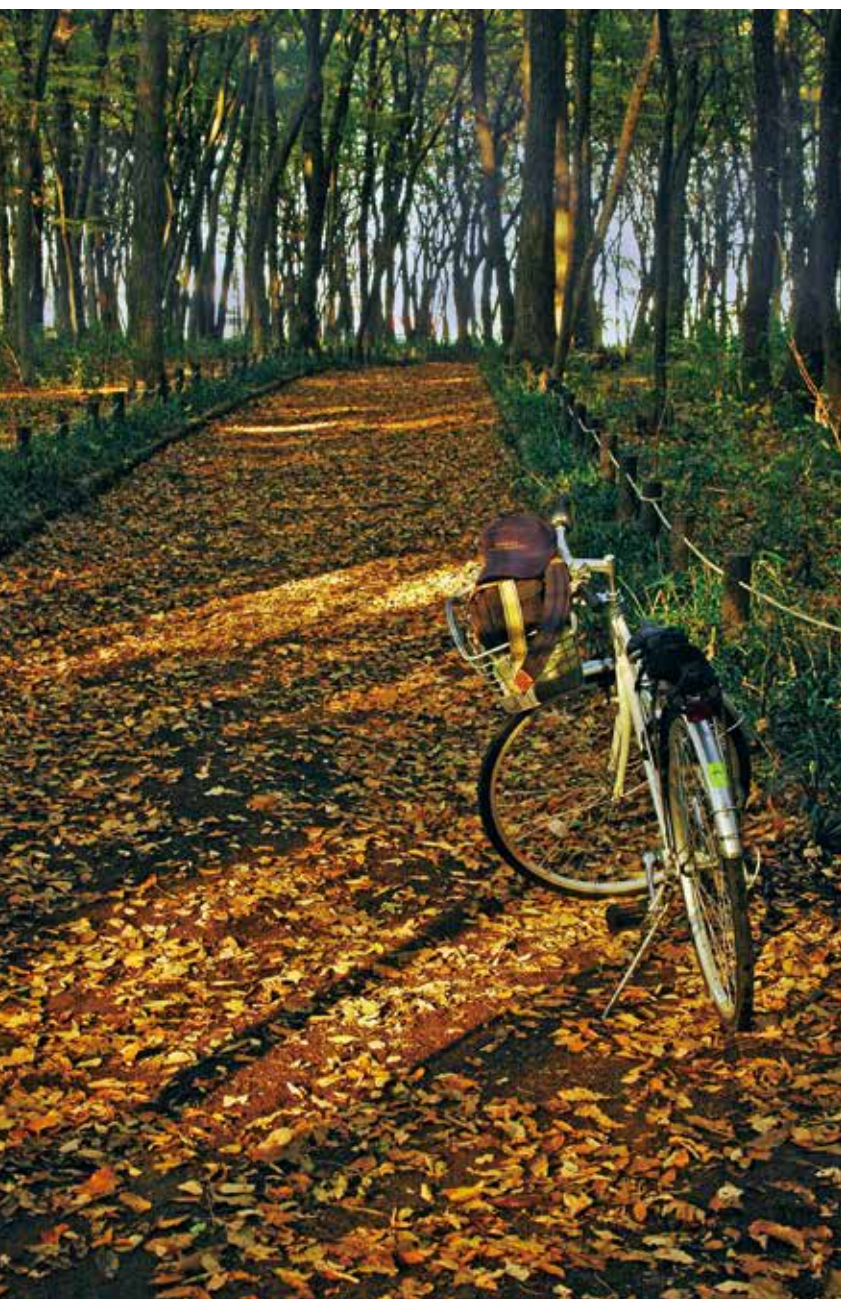
野火止緑地総合公園