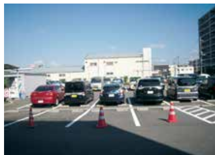
検査の待機所は駐車場

10分ほどして看護師から電話が来た。妻は、車の中で待つように言われる。正面玄関に行くと検温・