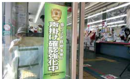
郵便局内 ATM 近くの掲示

「あなた様名義でカード支払いがありました。少し不審な点がありますので、そのご報告です」。その後、警察から電話。「〇〇署の〇〇課です。偽造カードが分かりました。被害届出されますか？」。そして銀行協会から電話。「カードを再発行します。係りの者を伺わせます」。