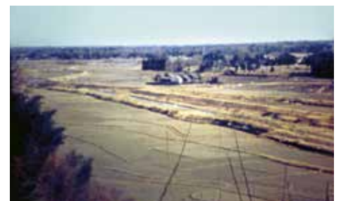
中野の豊かな田んぼ