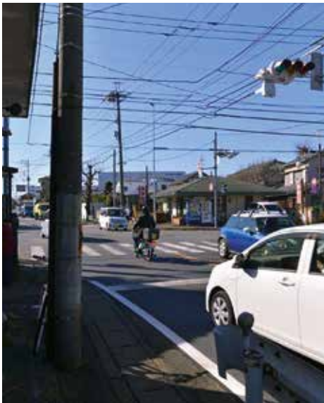
突当たりだったが、現カインズ方向へ抜ける交差点になった。中央奥に「魚久」。

ル」の特 選作品で、 まだまだ 珍しいカ ラーフィ ーム写真 です。富 士山が遮 るものも なく望め、