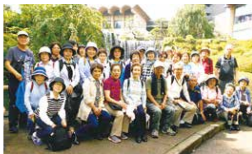
2018年6月 パレスホテルにて

像が建立されていきました。3時のおやつは有名な高木屋さんの草だんごを皆で食べました。6月は八国山と北山公園を散策し、花菖蒲を鑑賞。9月はお台場・全長10kmのレインボーブリッジを散策し、海上50mの爽やかな海風の中を歩いて渡りました。10月は昭和記念公園を散策。12月は靖国神社、皇居北の丸公園散策、銀杏並木と紅葉が見頃でした。