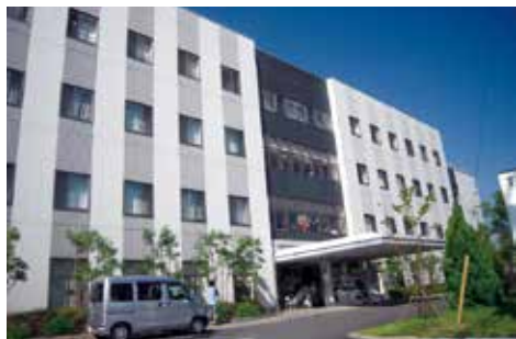
PCR 検査を受けた病院

のある病院に電話をする。相談センターとほぼ同じ質問を受けたあと、「10時に来院してください、病院の駐車場に着いたら、再び電話をください」と言われる。9時45分頃に駐車場に車を入れて電話すると車の車種、ボディカラー、ナンバーを聞かれる。答えると、完全防衛した看護師が真っ直ぐ車の所まで歩いて来た。駐車番号を指定され、1台おきに車を停めて窓を開けるように指示される。「順番がきたらこちらから電話するので、車の中で待っていて欲しい」と言う。