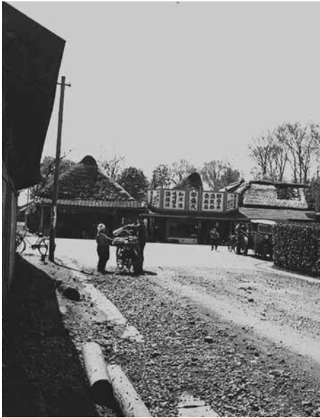
旧川越街道に現防衛道路が突当たる大和田中町。「魚久」の看板が見える。