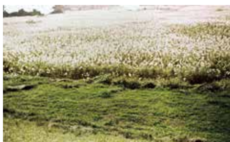
街道沿いの芒の原

柳瀬川の 中野側 (今の浦 所街道の 英IC付 近)には 豊かな田 んぼが広 がり、一 方では武