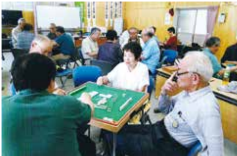
19年5月 第5回麻雀大会 (SC会議室)

4月号の会報を届けた先日、会員の人と話しが出来ました。「1ヶ月の入院生活を終えて、これから麻雀が出来ると思ったら、これだよ」とコロナの悔しさを