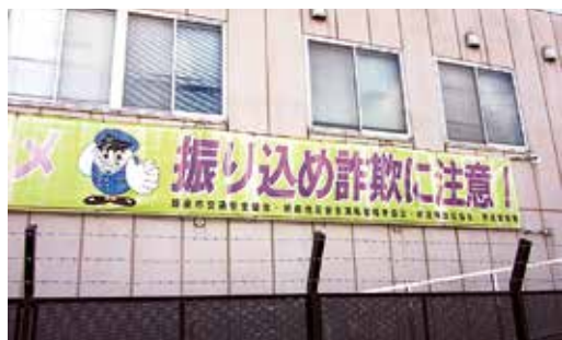
新座警察署協の目立つ横断幕

り少なくなりましたが、まだ多いです。被害を届け出ない人もいるんじゃないでしょうか」。新座警察は川