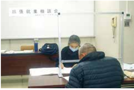
就業相談を受ける会員(手前)