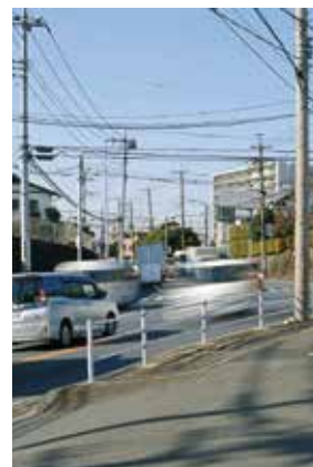
野火止坂上を見る

江戸への農産物供給基地となります。多数の人が集まり生活を営むことで、差別化の為の名称が付付けられていきます。人の営みの濃淡