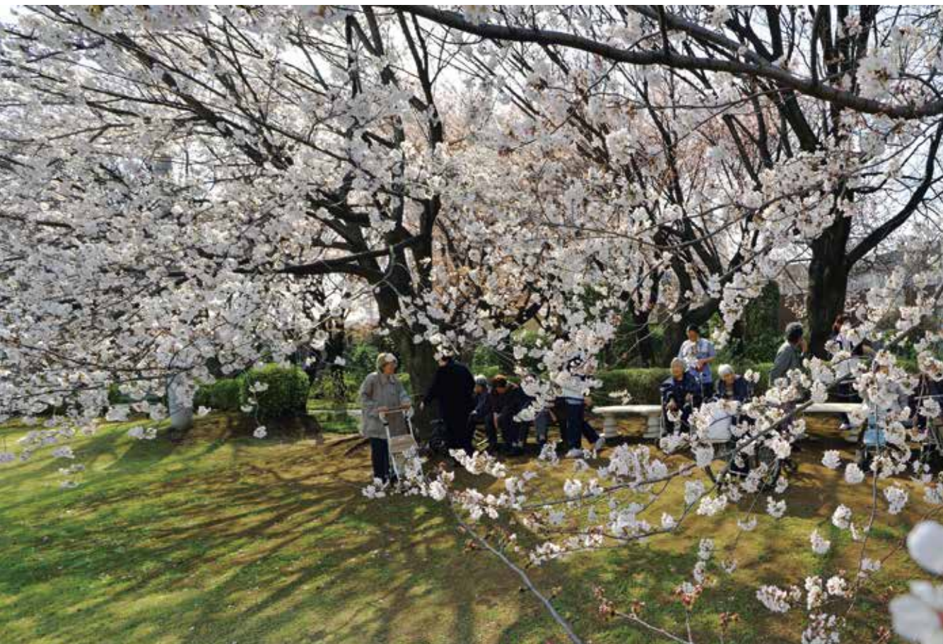
跡見学園女子大学（桜まつりにて）