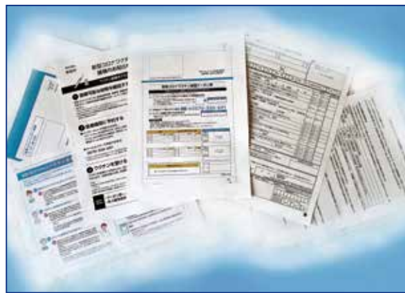
配布される作成途中の文書

接種希望の方は「接種のお知らせ・接種券（仮称）」の文書が届く前に、普段服用している薬について、かかりつけ医の先生にワクチンとの相性確認をしておくことをお勧めします。そのほうが文書受領後、スムーズに動けると思われます。尚、高齢者優先接種時期に受けなかった場合でも、事業実施期間中であれば接種は可能です。