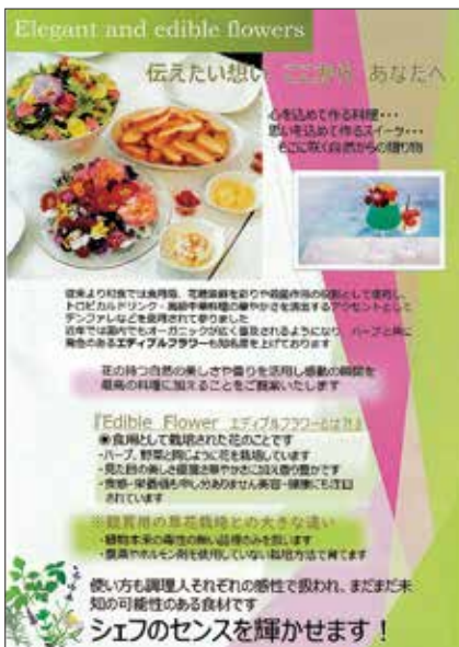
エディブルフラワーのパムフレット

「コロナ禍で制約が多いが、障がい者と健常者がここで出逢い、一緒に仕事をし、両者が働く場所、生活する場所・・・住処になるようにしたい」そのために仕事