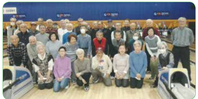
ボウリング大会参加者