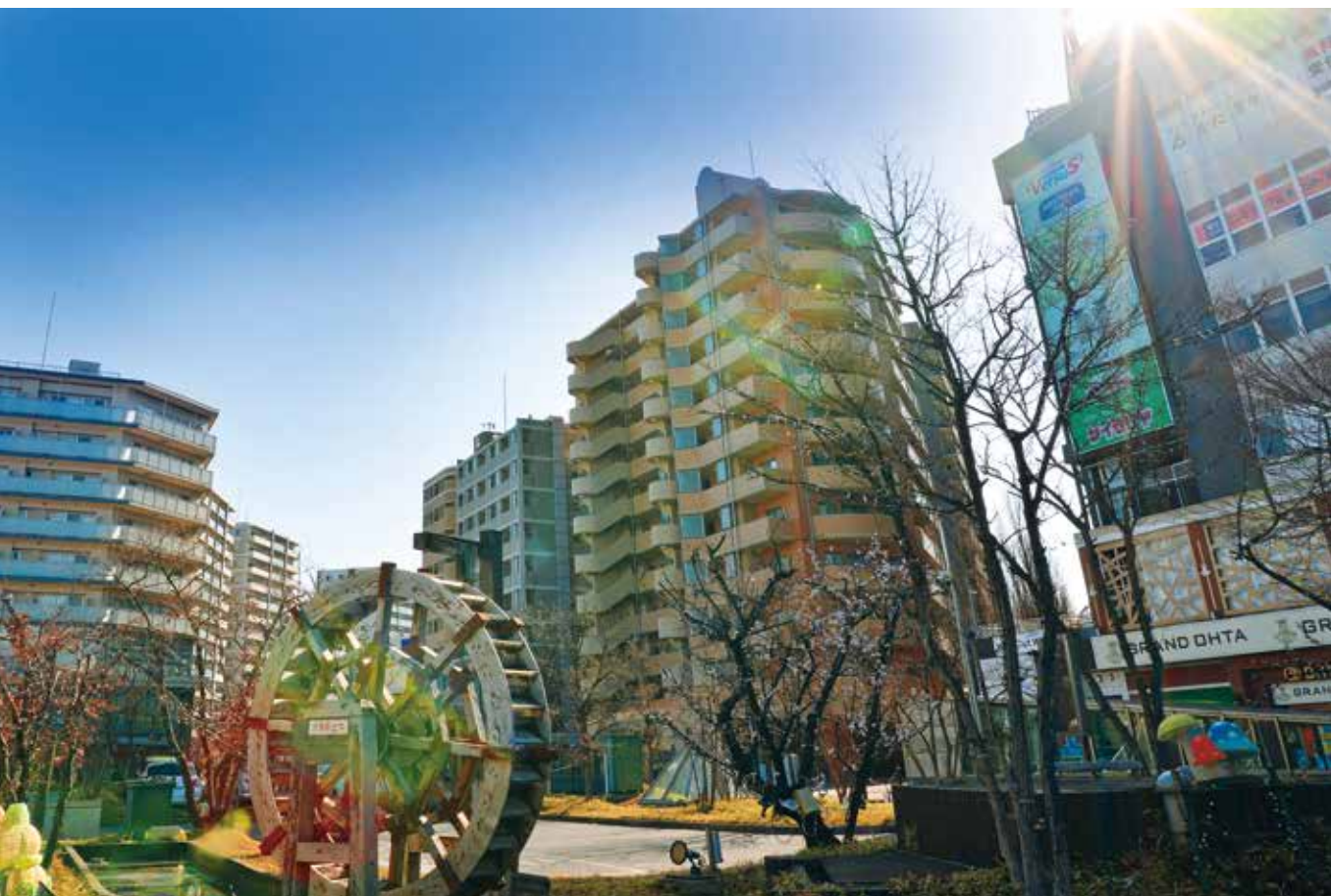
新旧おりなす朝の新座駅前