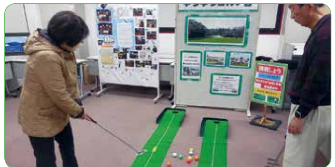
ゴルフサークルコーナー

春の日帰り旅行の実施は6月初め、行先を日光方面に企画しておりますが決定は3月末に行われる親睦会役員会議で検討して参ります。今回の親睦会文化祭は、初めて開催しましたが次以降も企画いたします。参加よろしくお願いたします。