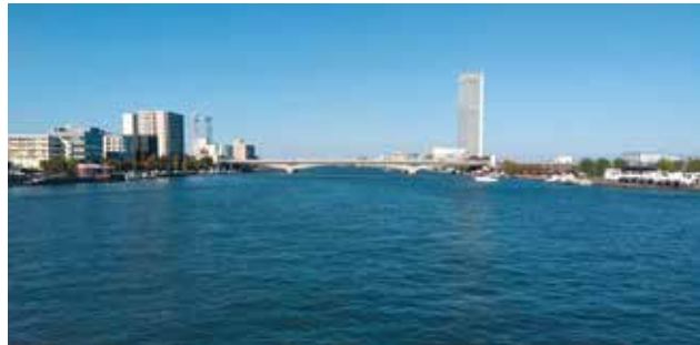
河口まで約3キロの万代橋から見る信濃川。右の高層ビルは新潟港西港区の朱鷺メッセ

信濃川河口の両岸は、国際拠点港湾の新潟港西港区。江戸時代には北前船が出入りし、明治維新直前に日米修好通商条約で横浜、神戸などと開港された5港の一つだそう。 昭和30年代からの在日朝鮮人帰還事業で北朝鮮との