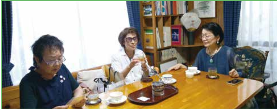
喫茶室でくつろぐ鑑賞者

立教大学正門前から朝霞市三原1丁目に至る道は「鐘の音通り」と称されている。その朝霞寄りの道沿いに小さな画廊がひっそりと佇んでいる。表看板に「ゲンガロウ」と書いてあるが、普通の民家のように。