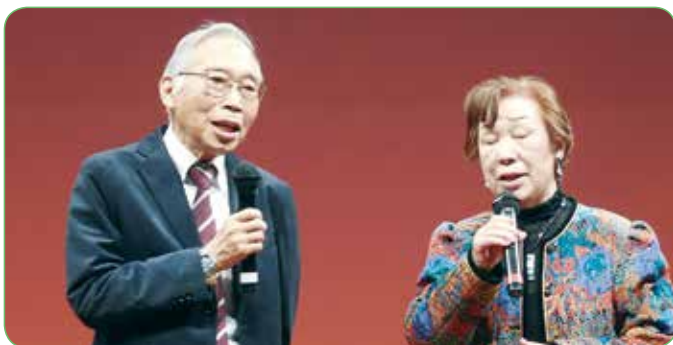
デュエットで歌う理事長と参加者