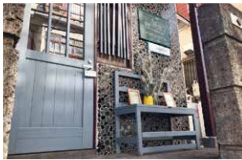
鐘の音通りに面した入口