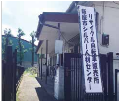
作業場・販売所 (石神1-1-5 北原集会所・横)