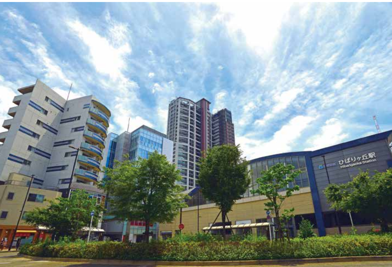
改修によりすっきりしたひばりヶ丘駅北口