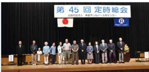
親睦会役員の写真