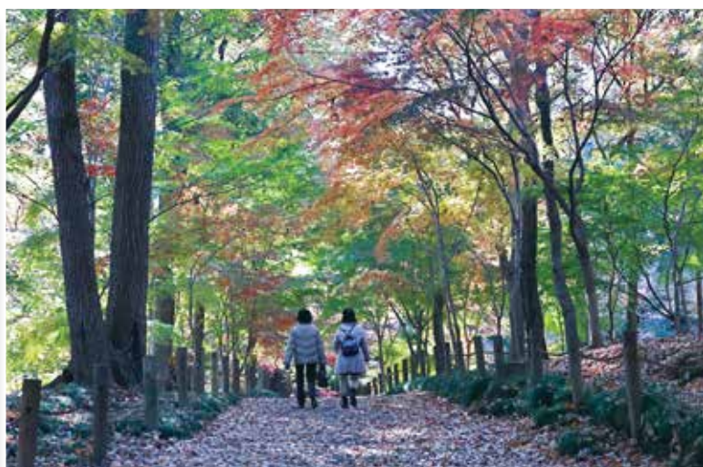
タイトル 木漏れ陽の中で 原田 凱光 野火止1