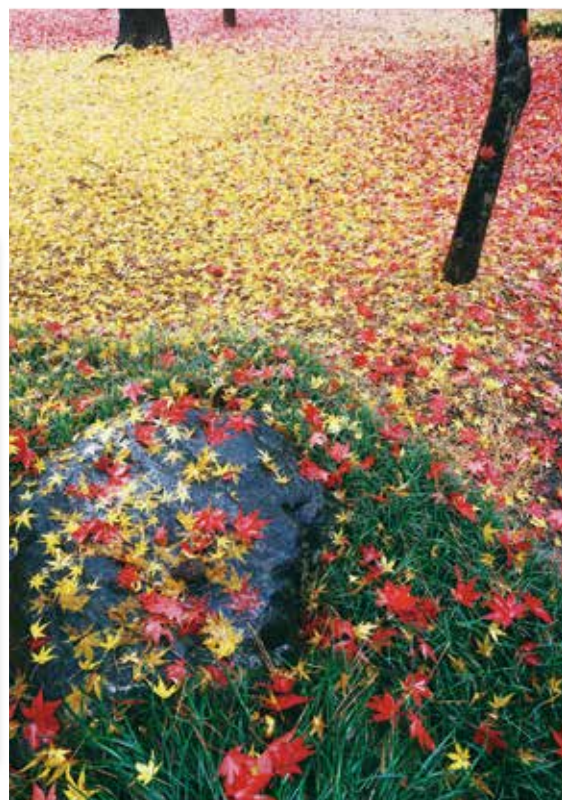
タイトル 紅葉 二度目のお勧め 竹内 博 野火止5