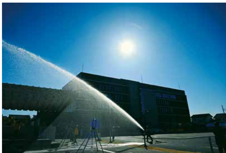
タイトル 備えあれば…… 金子 廣志 新座市教育長