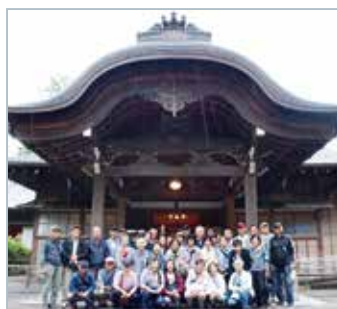
田母沢御用邸の前で

お土産はまず「日光おかし工房」で、その種類の多さに目を見張り、試食が食べ放題飲み放題。次のたまり漬「上澤梅太郎商店」では試食の大粒らっきょうに舌鼓。お財布の紐がゆるみっぱなし。いずれの店へもドライバーさんのおかげで、傘をさすことなく入店できました。帰りのバス内では恒例のビンゴで盛り上がり、渋滞なく予定通り帰途に着きました。