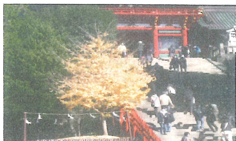
(折れた銀杏の木も伸びました)