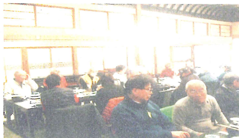
(楽しい語らいの場 昼食風景)

◎ 3年ぶりの秋の日帰り旅行。参加者は感激。両日とも天気が良く楽しい旅行が出来ました。