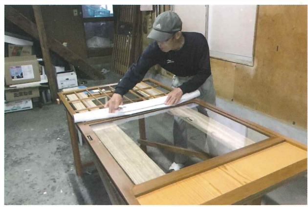
▲障子の張り替え作業