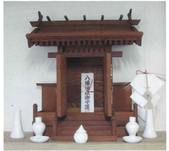
神棚が設置されました。