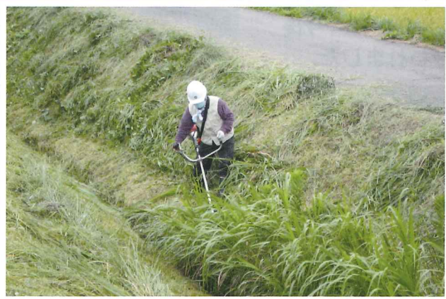
▲路肩の草刈り作業