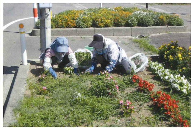
▲花壇の草取り作業