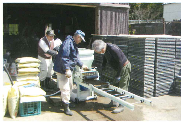
▲苗床の種まき作業