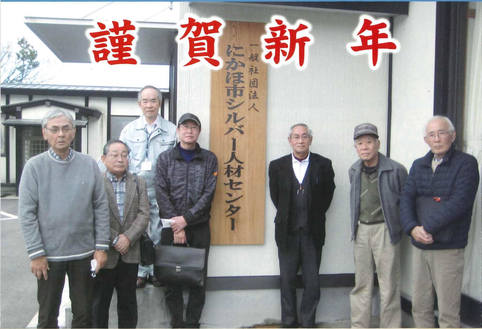
役員の方皆さんです