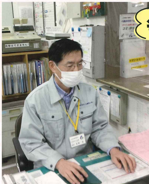
▲仁賀保公民館にて就業中

長年勤務した会社では、にかほ市以外の赴任地が多く、退職後、地域の方との交流や自身の健康のため、シルバー人材センターに登録したところ、仁賀保公民館の管理人としての仕事を紹介してもらいました。仁賀保公民館では現在6人の会員が交代で、公民館、体育館、テニスコート、サッカー場、武道館の窓口受付、用具の管理、施設予約の管理などの業務をしております。職員やサークルグループの方々の他にも、小中学生とのふれあいがあり、楽しく充実した仕事をさせてもらっています。