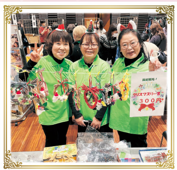
シルボンヌ全国大会2023in福岡に出店