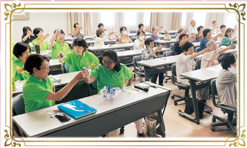
腸内環境が整うといいことだらけ!腸活について健康教室

昨年度、新たに発足した女性の会(にしお茶々ボンヌ)は年間を通じて講習会や講演会を開催しています。初開催の茶々ボンヌバザーは大盛況!