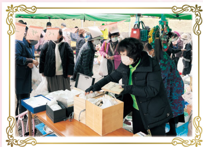
掘り出し物いっぱいの茶々ボンヌバザー