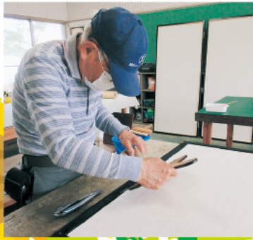
一本からでも承ります