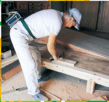
ちょっとした修繕等