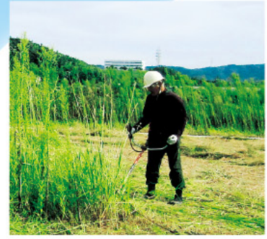
駐車場・空き地等の草刈