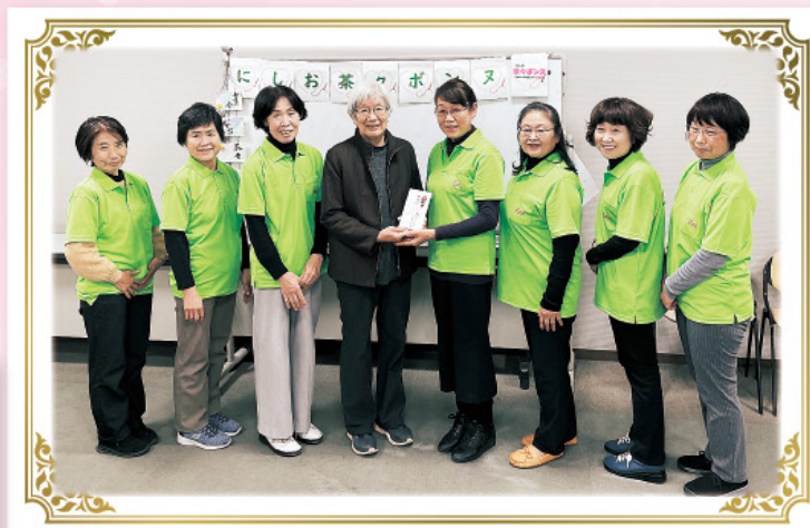
バザー売り上げを「フードバンクにしお」に寄付