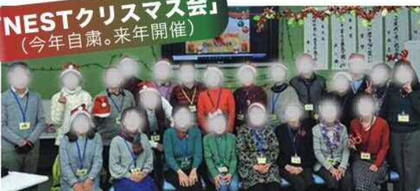
写真は令和元年に開催された「クリスマス会」です。