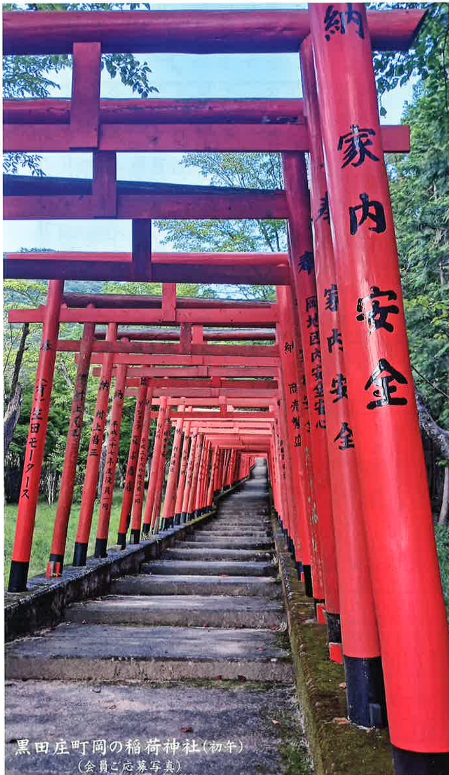
黒田庄町岡の稲荷神社(初午) (会員ご応募写真)