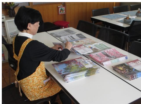
チラシを本体に折込む