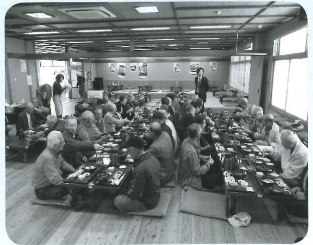
那智大社. ねぼけ堂にて昼食