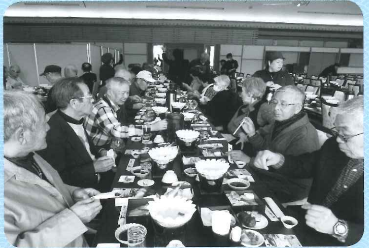
世界遺産 熊野 鬼ヶ城にて昼食