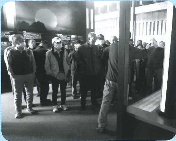
三重県立熊野古道センター