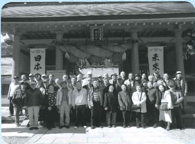
熊野速玉大社〈国宝がある歴史ある大社〉