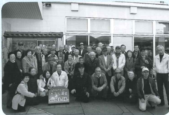
ホテル浦島玄関前記念撮影