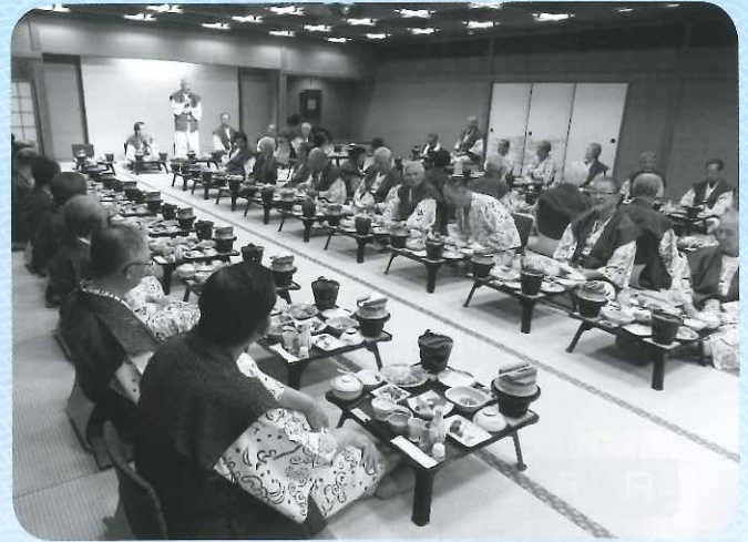
ホテル浦島 大宴会風景