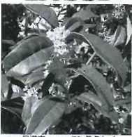
日進市 シンボルキンモクセイ