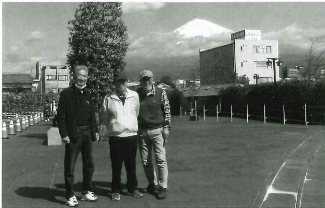
富士山をバックにて

目的地に向かい順調に走行、バス中ではお菓子・お茶・ビール缶などが振舞われました。 午前中は「富士世界遺産センター」を見学後、「富士山浅間大社」を参拝。晴天に恵まれ富士山の絶景を望め一同感動でした。 昼食後は「山梨シャトーワイナリー」で見学&試飲体験。試飲ワインを堪能し、おすすめワインなどを皆さん購入されました。 その後、本日の宿泊先（宴会先）「石和びゅーほてる」へ。温泉に入った後、夕食は宴会場で、皆さんお酒も入り、カラ